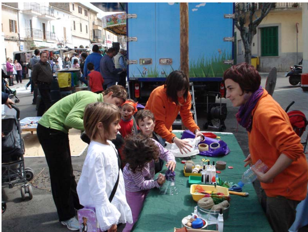
Fotografías 7 y 8. Imágenes de la jornada dedicada a sensibilización infantil en temas de reducción de residuos y reciclaje.