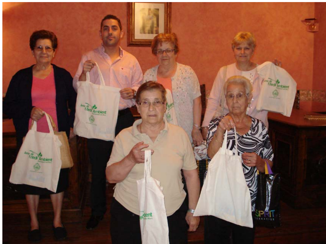
Fotografía 14. El regidor de medio ambiente haciendo entrega de los primeros packs de eficiencia energética a cinco vecinas del municipio.