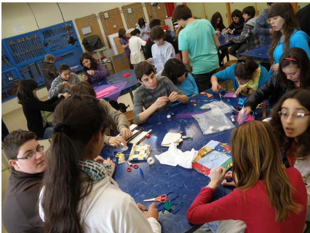
Fotografías 21 y 22: Imágenes de la campaña escolar de educación ambiental. La foto superior pertenece a la actividad de Compra Responsable y la inferior al Trivi Fems.