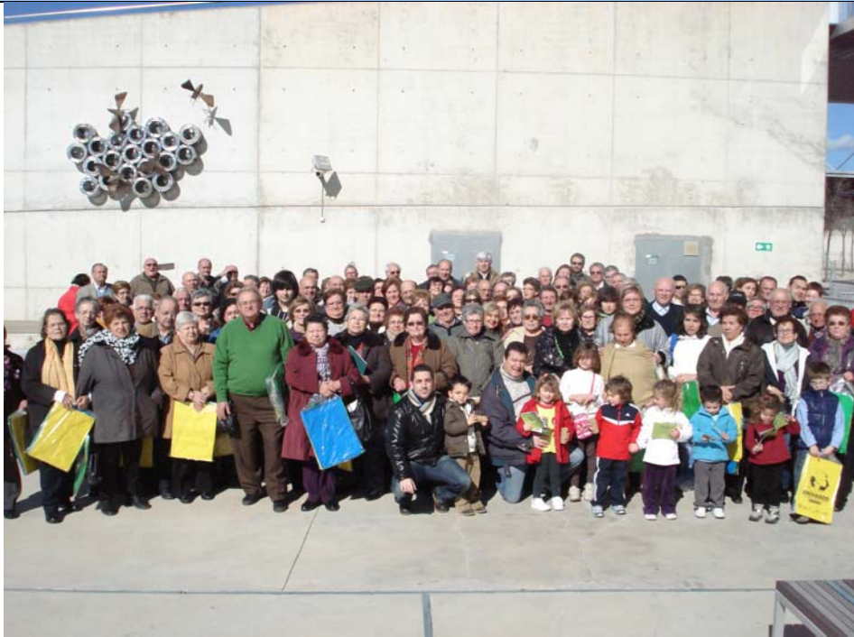
Fotografía 1. Foto de grupo de la visita al Parque de Tecnologías Ambientales Es Parc