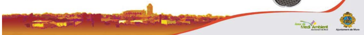
Documento 2. Contraportada del programa de las fiestas patronales de San Juan, donde se anunció la entrega del pack energético a los residentes del municipio.