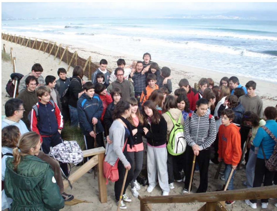
Fotografía 3. Alumnos de del IES Albuhaira posando antes de iniciar las tareas de reforestación.

NOMBRE DE LA ACTIVIDAD: REFORESTACIÓN EN LAS DUNAS DE ES COMÚ DE MURO