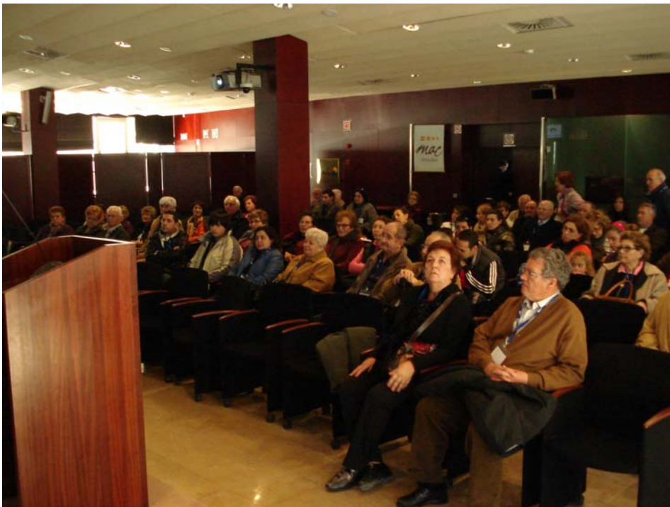
Fotografía 2. Asistentes prestando atención a lña charla sobre residuos que ofreció un técnico del parque.