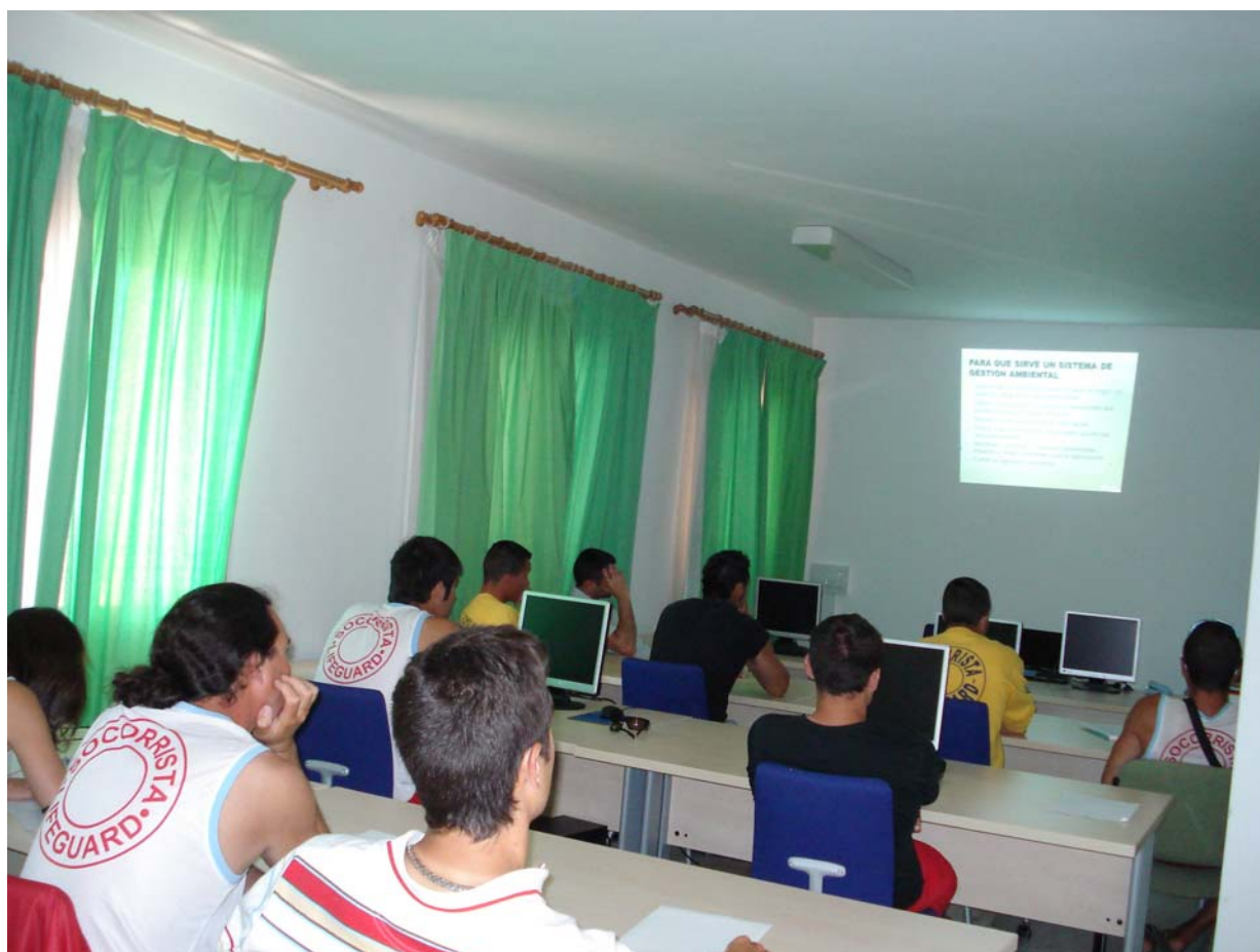
Fotografía 11. Trabajadores de las diferentes empresas implicadas en la gestión y servicios de las playas atendiendo a las explicaciones sobre la implantación del sistema de gestión ISO 14001:2004.