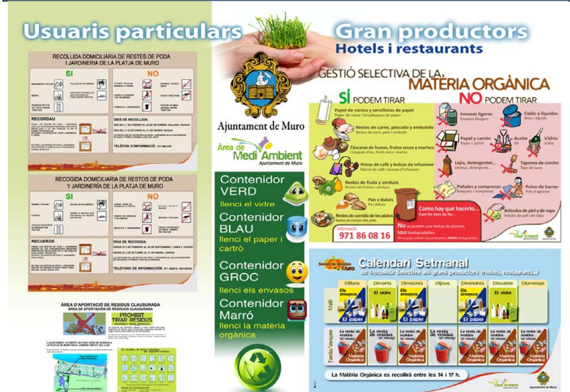
Documento 4. Panel informativo expuesto en el stand del Área de Medio Ambiente en la Feria de Playa de Muro.