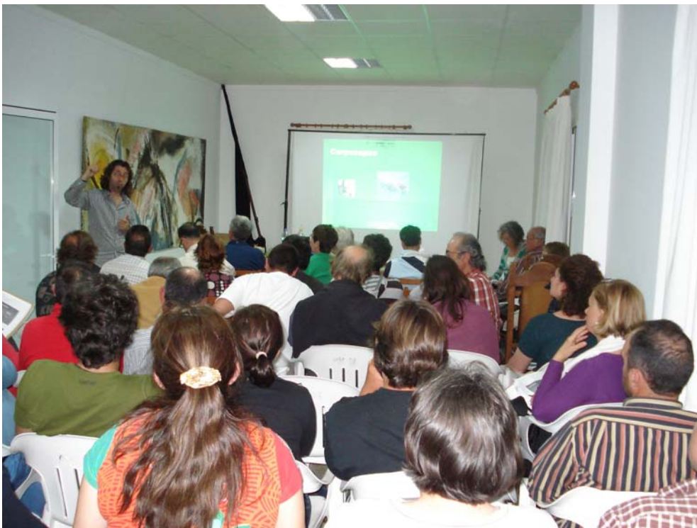
Fotografías 9 y 10. Asistentes al curso de agricultura ecológica atendiendo al profesor.