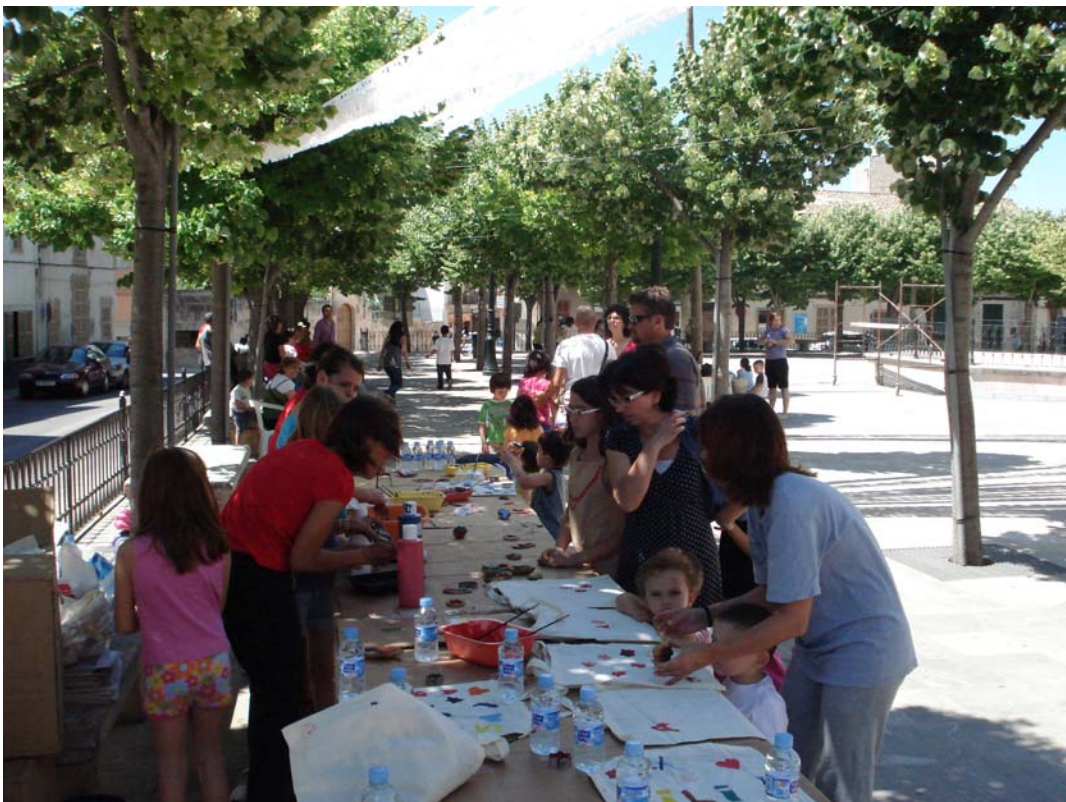
Fotografías 12 y 13. Celebración del día mundial del medio ambiente mediante actividades de cuenta cuentos y un taller de pintar bolsas reutilizables.