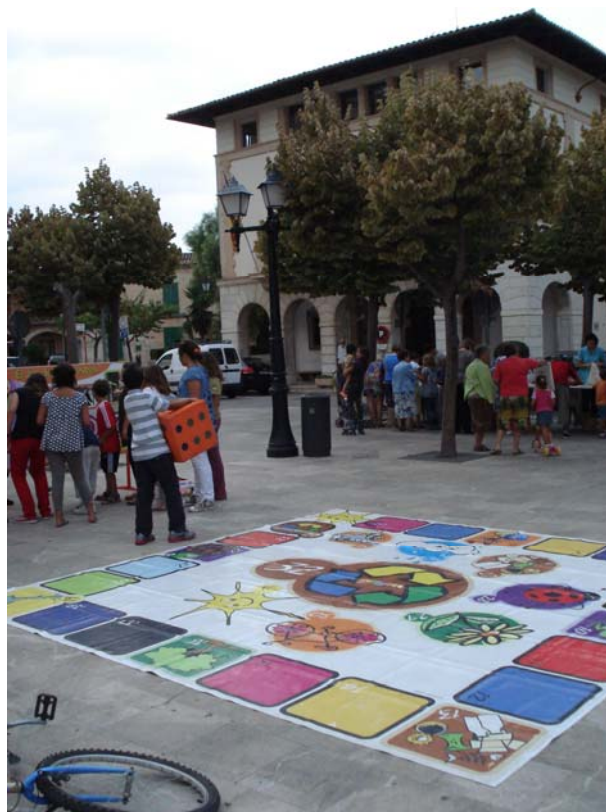
Fotografías 17 y 18. Actividades infantiles en la plaza del pueblo con motivo de la celebración de la Semana Europea de la Movilidad y el día sin coches.