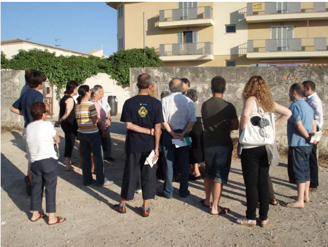
Fotografías 15 y 16. Momento del cursillo sobre compostaje doméstico que se llevó a cabo en las instalaciones del Parque Verde de residuos del pueblo.