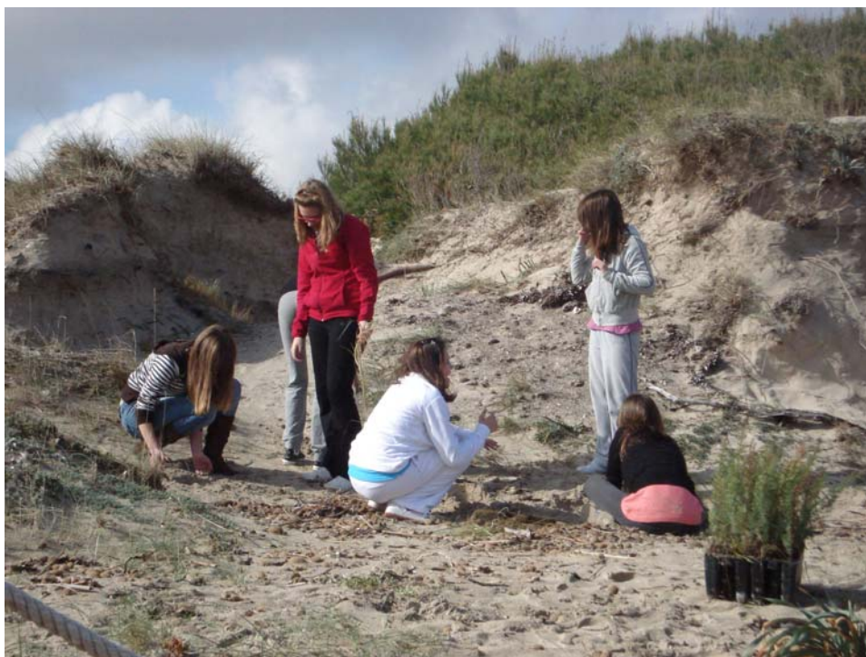
Fotografía 4. Alumnas del IES Albuhaira en plena tarea de reforestación.