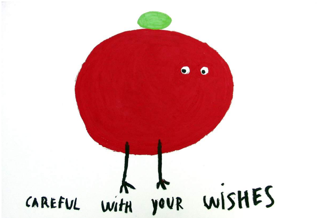
Javier Calleja, "Careful with your wishes", óleo sobre papel, 112 x 75 cm., 2016

LOS ARTISTAS · JAVIER CALLEJA (Málaga, España, 1971)