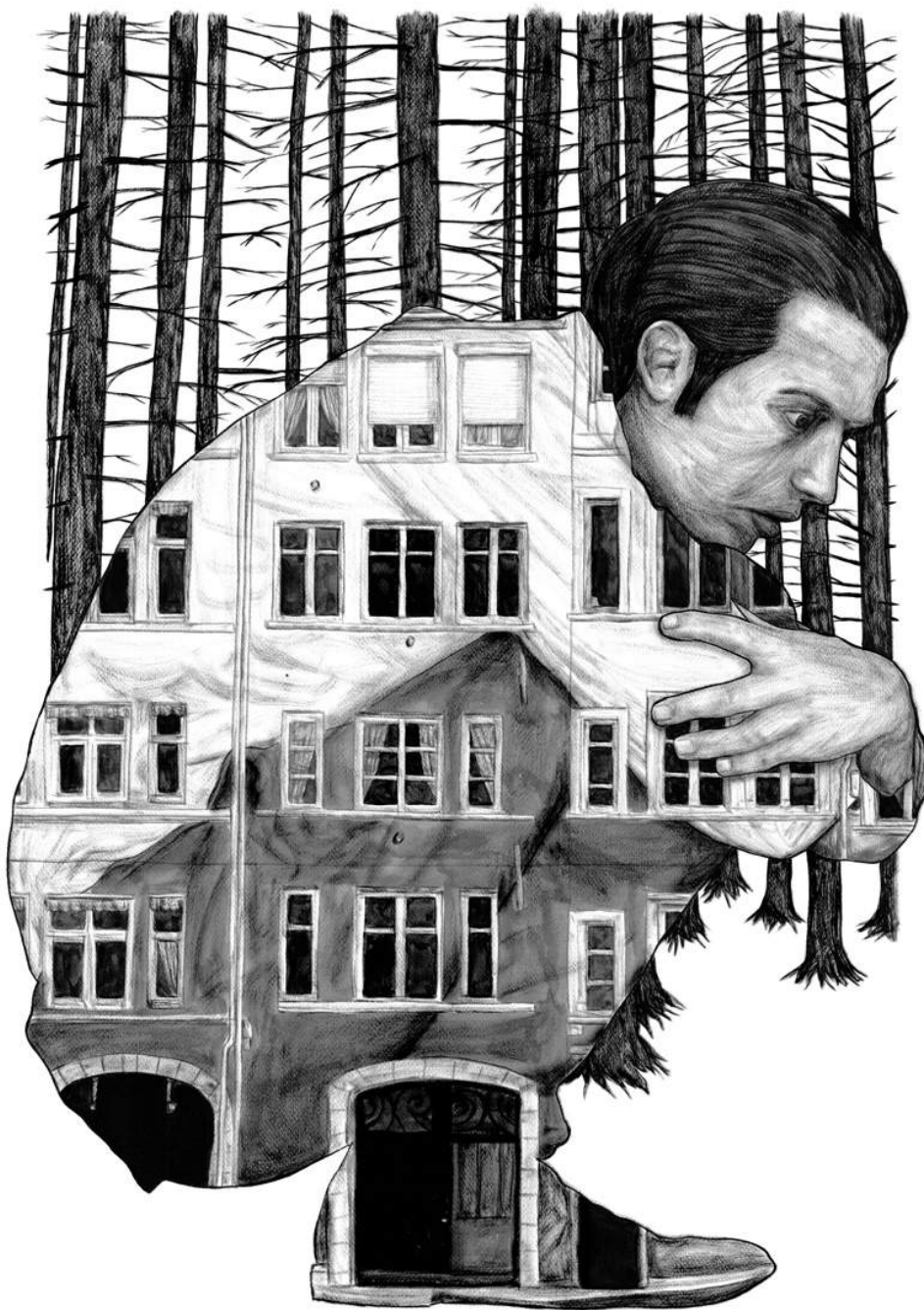
Levalet, "Claustrophobia", digraphie sobre papel de 350g, ed. 21

LOS ARTISTAS - LEVALET (Epinal, Francia, 1988) http://www.levalet.xyz